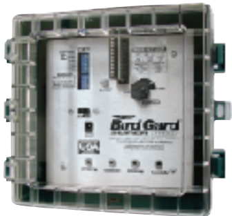
Model/ Modèle/ Modelo/ Modell/ Modello #0041