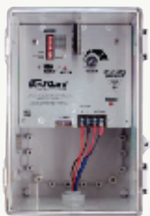
Model/ Modèle/ Modelo/ Modell/ Modello #0027