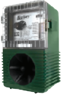
Model/ Modèle/ Modelo/ Modell/ Modello #0033