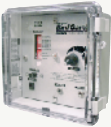
Model/ Modèle/ Modelo/ Modell/ Modello #0030