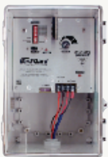
Model/ Modèle/ Modelo/ Modell/ Modello #0027