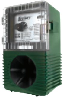
Model/ Modèle/ Modelo/ Modell/ Modello #0033